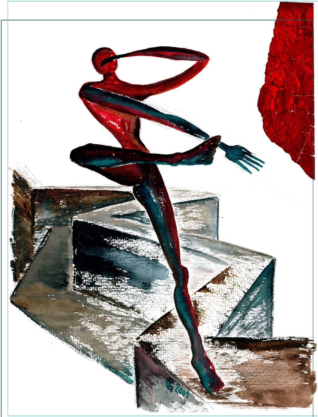
Gratwanderung 1 (Dezember 2001)