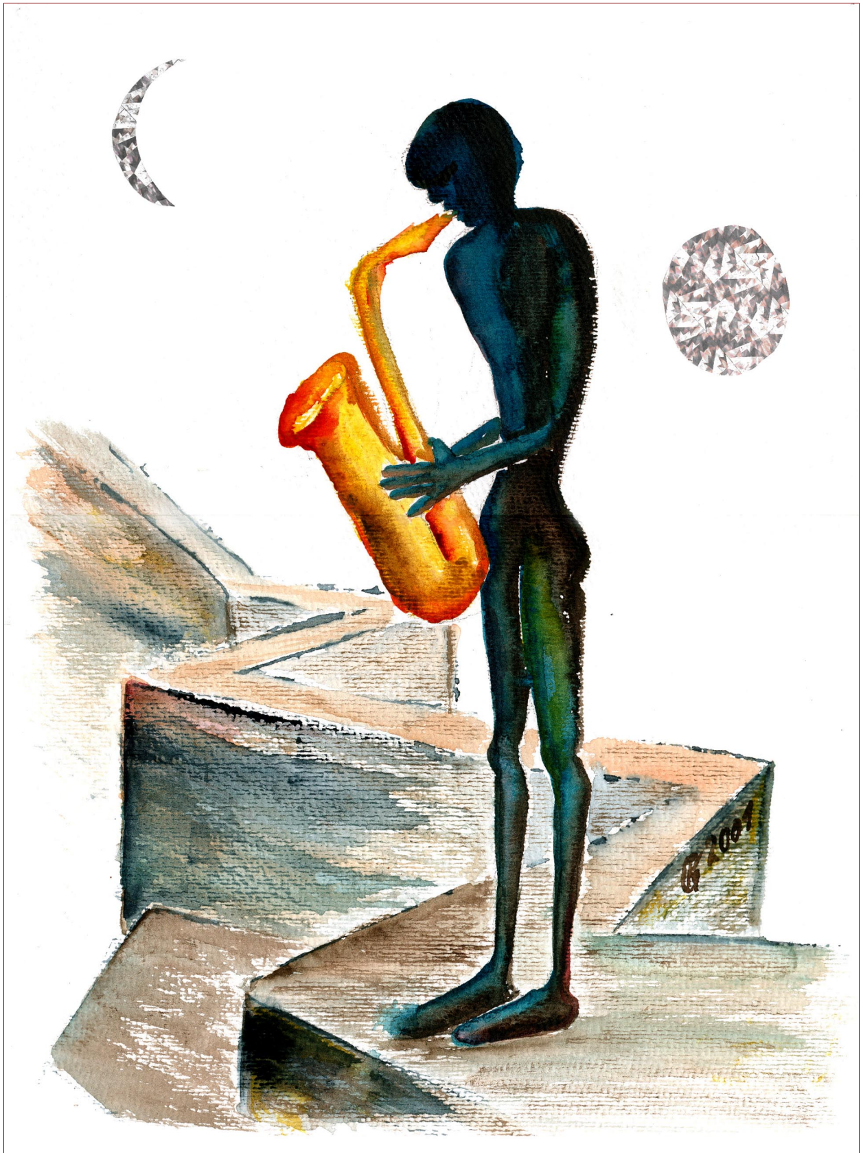
Gratwanderung 3 (Dezember 2001)